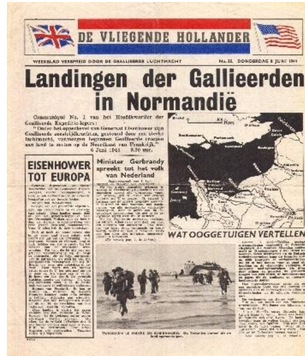
Een krant die uit de lucht kwam vallen

Dat vertel ik je nog wel eens', antwoordt zijn vader geheimzinnig.