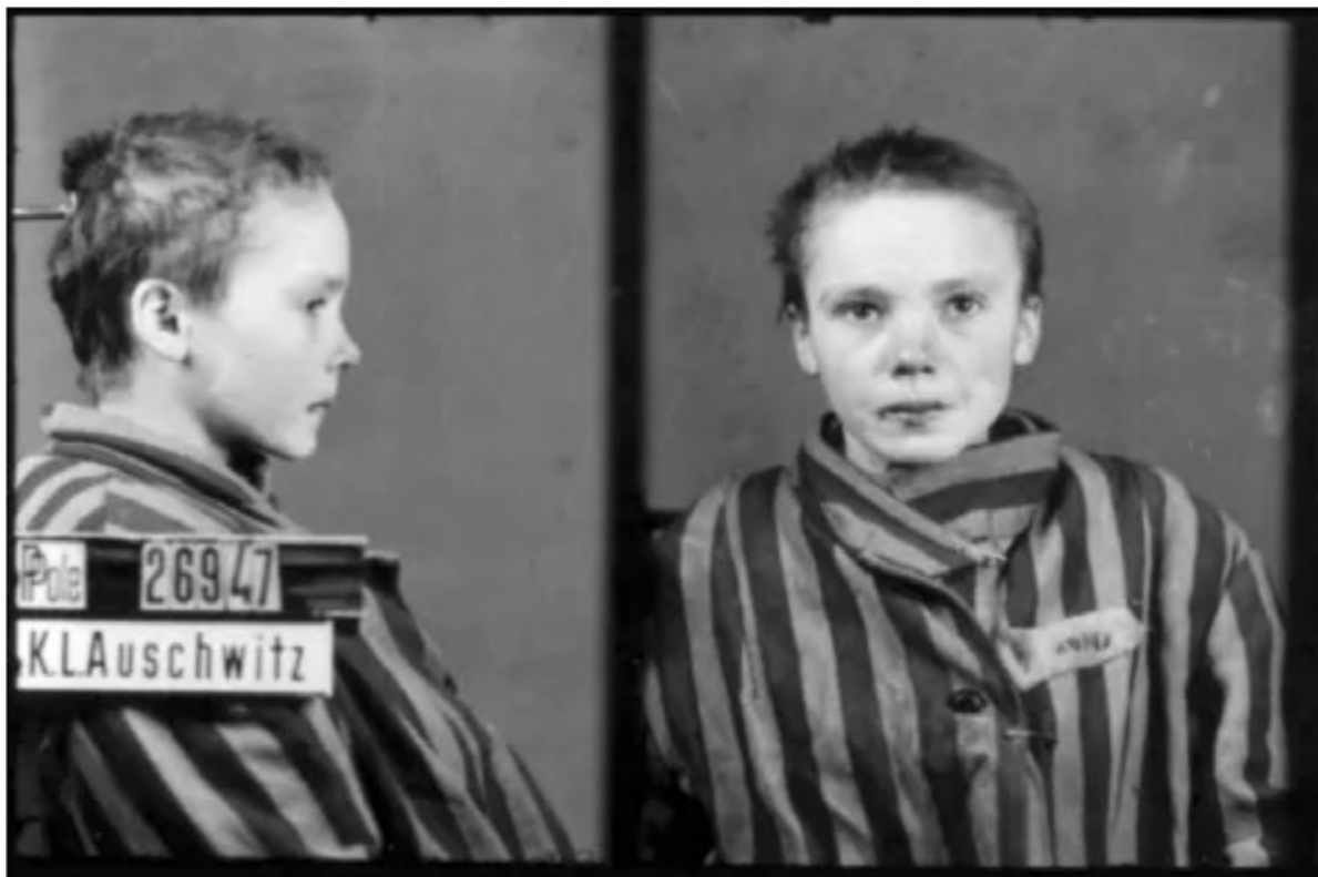
Een meisje bij aankomst in Auschwitz, de foto is gemaakt door SS-kampfotograaf Brasse

Hoe werd Auschwitz na de oorlog wel genoemd? Waarom?