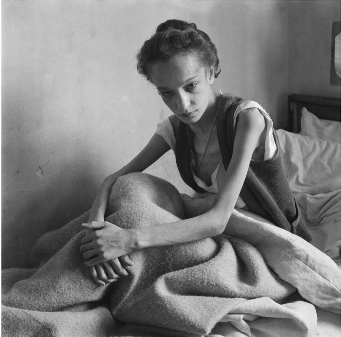
Een Nederlands meisje dat is teruggekeerd uit concentratiekamp Bergen-Belsen