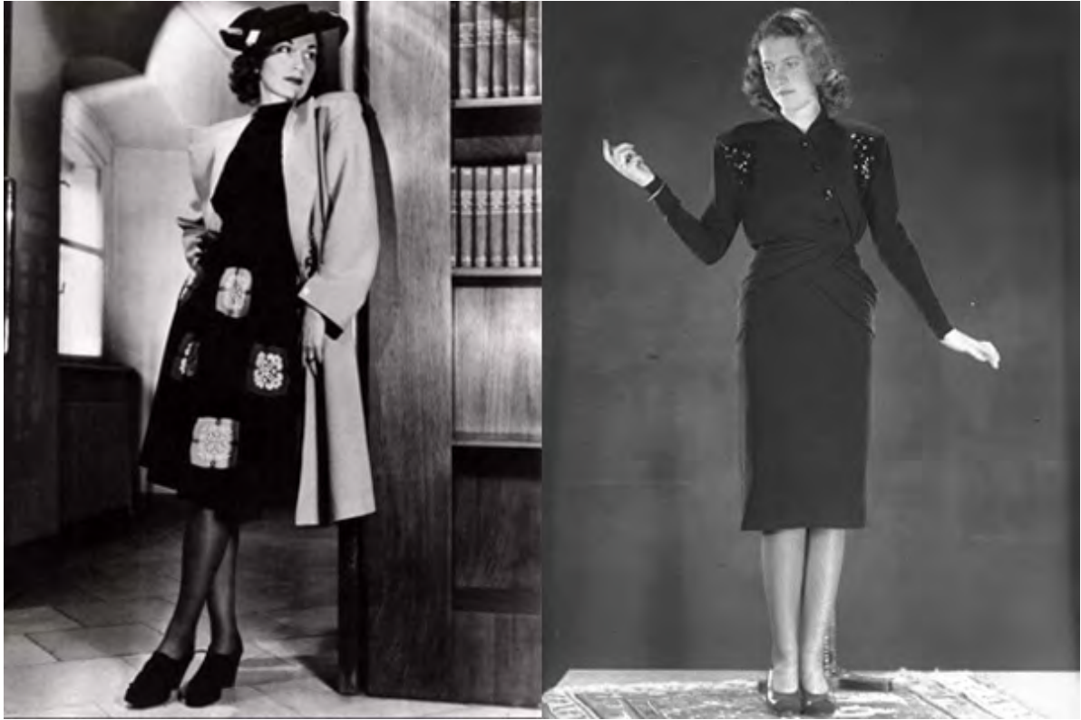
mode uit de jaren '40