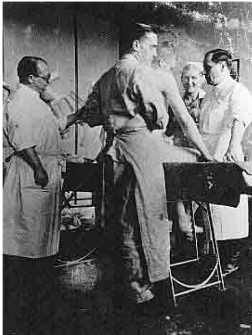
Nazi-artsen aan het werk in blok 10, Auschwitz